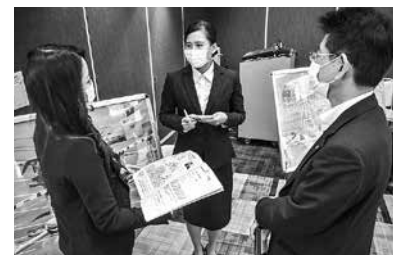
〈マッチングイベントの様子〉